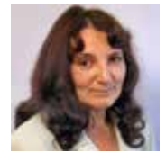
Írta és fényképezte: Stanyó Tóth Gizella újságíró