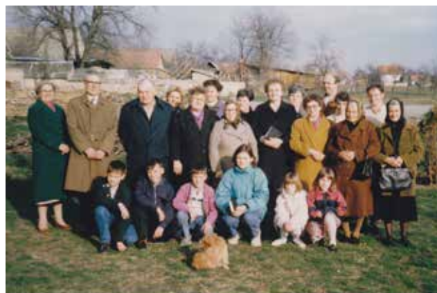
A tiszakálmánfalvi gyülekezet a '90-es években