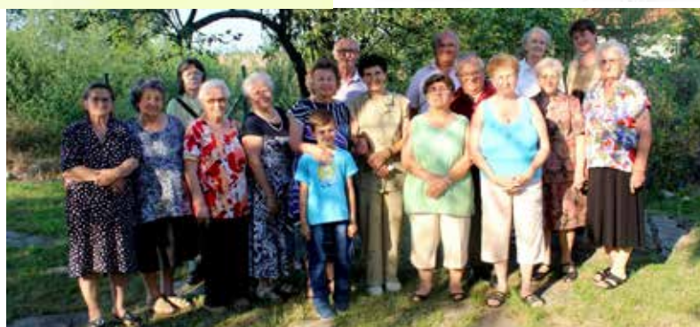
Módsi istentisztelet után 2018-ban