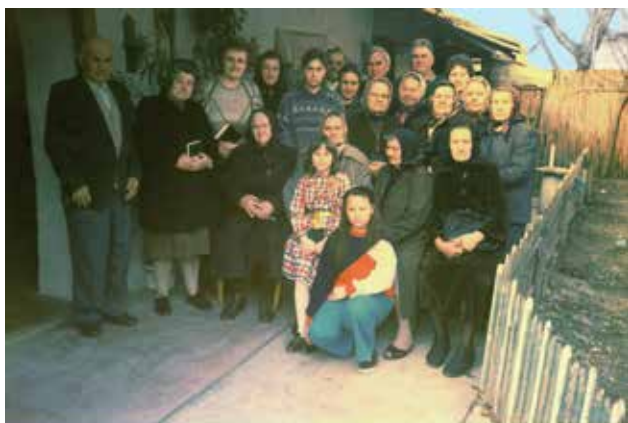
A kátyi gyülekezet az 1990-es években