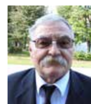
Halász Béla püspök

Az Úr Jézus Krisztusnak kegyelme, Istennek szeretete és a Szentléleknek közössége mindnyájatokkal! Ámen.